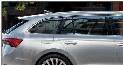
SUNSET - przyciemniane tylne szyby boczne i szyba pokrywy bagażnika