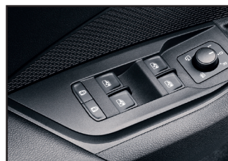
Elektryczna blokada otwarcia tylnych drzwi od wewnątrz