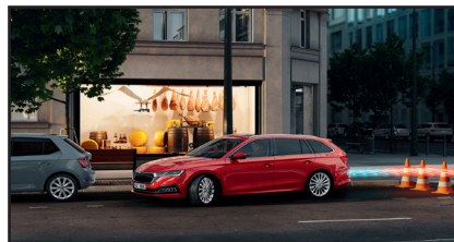
Czujniki parkowania z tyłu oraz z przodu z MANOEUVRE ASSIST