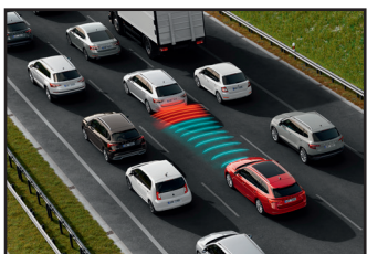
ADAPTIVE CRUISE CONTROL - aktywny tempomat do 210 km/h