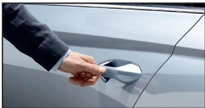
KESY FULL - bezkluczykowy system obsługi samochodu