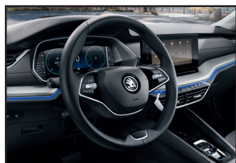
Pakiet oświetlenia LED AMBIENTE