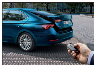
Elektrycznie sterowana pokrywa bagażnika